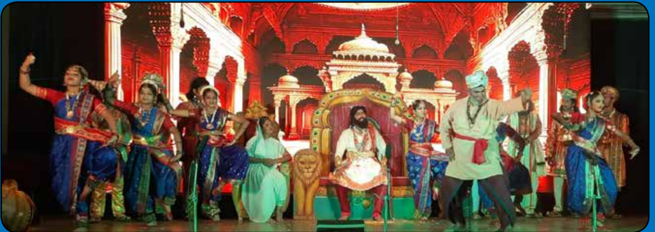
జయహో ఛత్రపతి శివాజీ మహారాజ్ నాటకంలోని దృశ్యం

Editor & Publisher : Ganakala, M.Venatarao