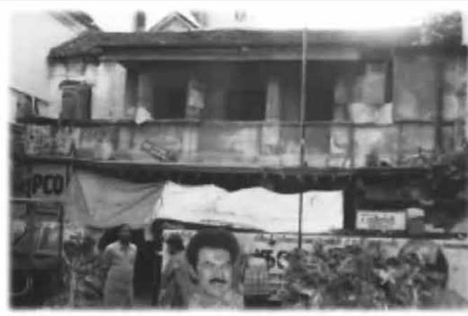
త్యాగయ్యర్ నివసించిన ఇల్లు

9) ఆదితాళ వర్ణ సర్వస్వము - మొదటి భాగం - సంకలనం : ప్రొ॥ వి. తిరుపతయ్య