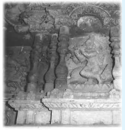
త్యాగయ్యర్ ఇంటి ద్వారంపై గల వేణుగోపాలుని దారు శిల్పం