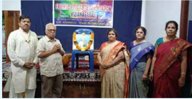
బాలమురళి చిత్రపటానికి పూలమాలలు వేస్తూ నివాళులు అర్పిస్తున్న అసోసియేషన్ సభ్యులు