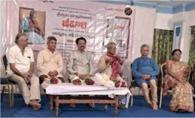
సమావేశంలో మాట్లాడుతున్న వక్తలు

తెలంగాణ భాషా సాంస్కృతిక శాఖ, మరువం చర్చావేదిక ఆధ్వర్యంలో శుక్రవారం రవీంద్రభారతిలోని సమావేశ మందిరంలో ప్రఖ్యాత వయోలిన్ కళాకారుడు, సంగీత విద్వాంసులు, విజయనగరం మహారాజా ప్రభుత్వ సంగీత, నృత్య కళాశాల పూర్వ అధ్యక్షుడు శ్రీద్వారం