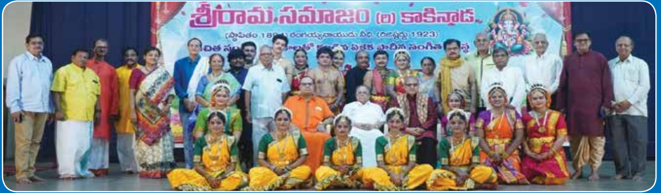
శ్రీరామ సమాజం 130వ సంగీతోత్సవాలలో 8-9-2024న నృత్య ప్రదర్శన చేసిన నాట్యగురువులు, గౌరవసభ్యులు, శిష్యులు