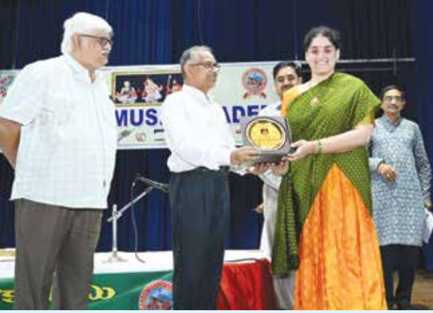
తృతీయ విభాగము - ప్రథమ బహుమతి