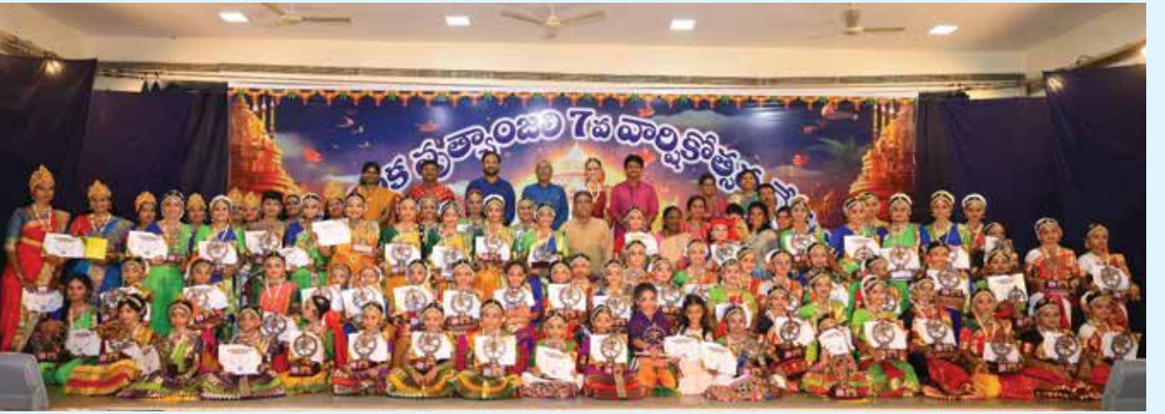
10-08-2024 శనివారం పల్లక నృత్యాంజలి, కాకినాడ సంస్థ 7వ వార్షికోత్సవంలో పాల్గొన్న విద్యార్థులు