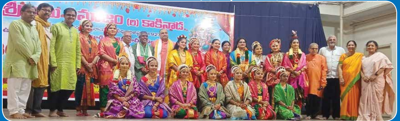
శ్రీరామ సమాజం 130వ సంగీతోత్సవాలలో 15-9-2024న “ఆతడే పరబ్రహ్మము” సంగీత నృత్య రూపకాన్ని ప్రదర్శించిన కళాకారులు, శ్రీరామసమాజ కార్యవర్గ సభ్యులు