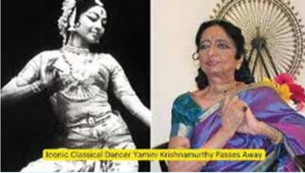
Iconic Classical Dancer Yaminī Krishnamūrti Passes Away

యామినీ కృష్ణమూర్తి ఒక భారతీయ నర్తకి. భరతనాట్యం, కూచిపూడి, ఒడిస్సీ నృత్యాలలో నిష్ణాతురాలు. కూచిపూడి నృత్యానికి దేశవిదేశాలలో పేరు తెచ్చిపెట్టింది. కర్ణాటక సంగీతం కూడా నేర్చుకుని పాటపాడుతూ నృత్యం చేసి ప్రదర్శనలు ఇచ్చింది. ఆమె ఆంధ్రప్రదేశ్ లోని మదనపల్లిలో 1940వ సంవత్సరం డిసెంబరు 20న జన్మించింది. ఈమె తండ్రి కృష్ణమూర్తి సంస్కృత పండితుడు. తాత ఉర్దూ కవి. అటుపై వాళ్ల కుటుంబం తమిళనాడులోని చిదంబరంలో స్థిరపడింది. భరతనాట్యం, కూచిపూడి నృత్యాల్లో ప్రావీణ్యం సంపాదించిన యామినీ 1957లో తొలి నృత్య ప్రదర్శన ఇచ్చింది. అప్పటి నుంచి వేలాదిగా ప్రదర్శనలిచ్చి దేశ, విదేశాల్లో పేరు పొందినది.