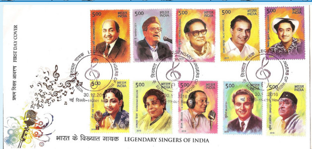
First day cover of Legendary Singers of India including RS.5 stamp on Bhupen Hazarika