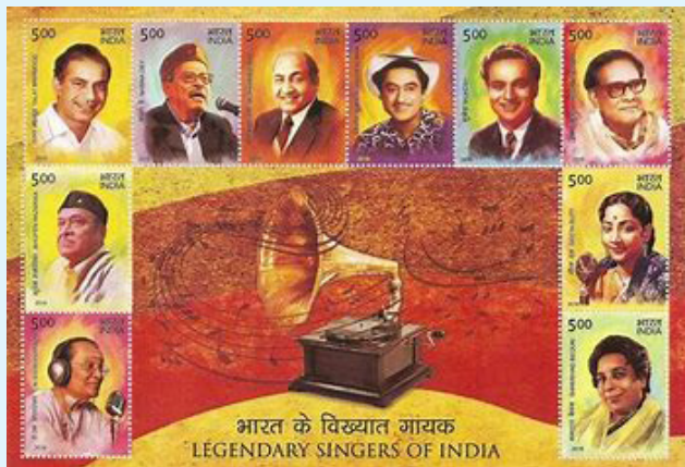
Sheetlet of Legendary singers of India Professional life