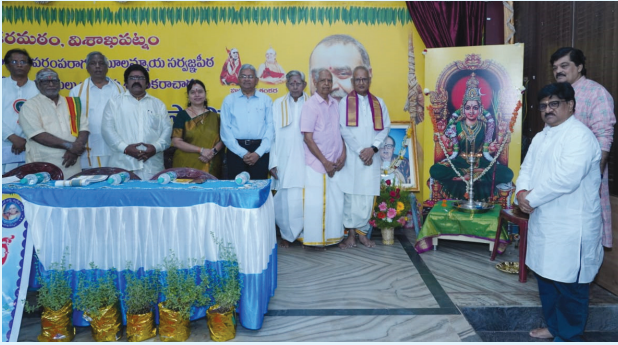
జ్యోతిని వెలిగించి నూతన సంగీత సంస్థను ప్రారంభిస్తున్న దృశ్యం