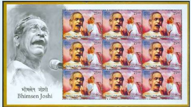
Sheetlet of Pandit Bhimsen Joshi

Sheetlet of the two Bharat Ratnas Pandit Ravi Shankar and Pandit Bhimsen Joshi and six other famous musicians who are Padma Vibhushans