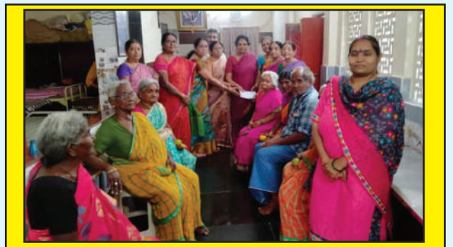
తెనాలిలో 12.2.2024న త్యాగరాజ ఆరాధన..