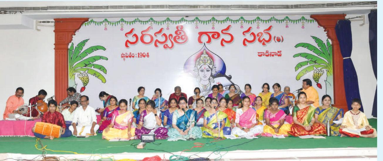
కాకినాడ సరస్వతీగానసభ ఆధ్వర్యంలో జరిగిన పంచరత్న సేవ.