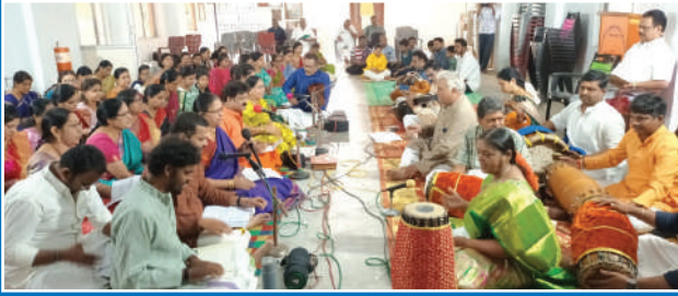
సద్గురు శ్రీ త్యాగరాజ స్వామి వారి 177 వ ఆరాధన ఉత్సవాలు సందర్భంగా రాజమహేంద్రవరం విజయ శంకర ప్రభుత్వ సంగీత నృత్య పాఠశాలలో పంచరత్న సేవ