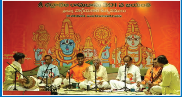
శ్రీ భద్రాచల రామదాసు 391వ జయంతి ఉత్సవాలు