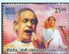
Stamp of Bhimsen Joshi issued in 2014

In 1964, King of Afghanistan, Mohammad Zahir Shah, himself invited Pandit Joshi for a concert in Kabul. Between 1964 and 1982 Joshi toured Italy, France, Canada and USA. He was the first musician from India whose concerts were advertised through posters in New York city, United States.