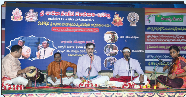
8.1.24 న మల్లాది సోదరుల గాత్రయుగళం.