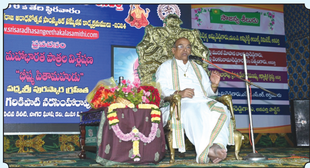
జనవరి 4,5,6 తేదీలలో శ్రీ గరికిపాటి నరసింహారావు - భారతంపై ప్రవచనం.