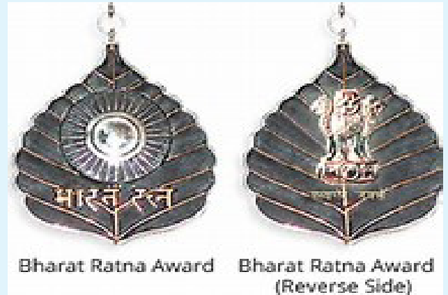
Bharat Ratna Award