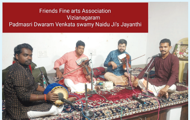
Friends Fine arts Association Vizianagaram Padmasri Dwaram Venkata swamy Naidu Ji's Jayanthi