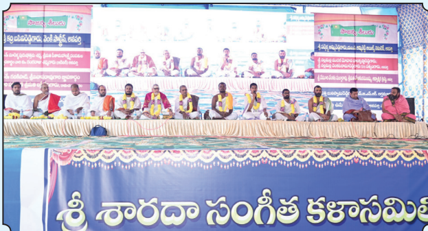
7.1.24 న వేదస్వస్తి.