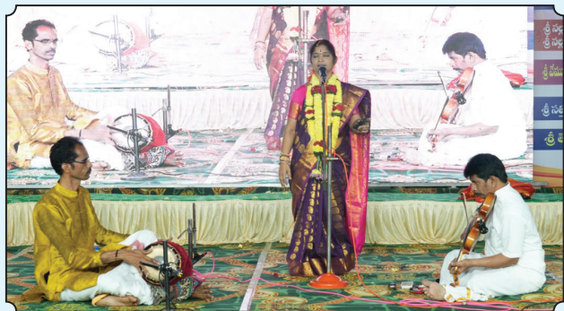
2.1.24 న వై.శిఖామణి భాగవతాలిణి హరికథ.