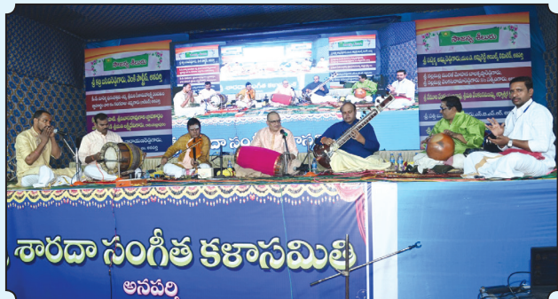
7.1.24 న పెరవలి జయభాస్కర్ బృందం - వాద్యతరంగిణి.