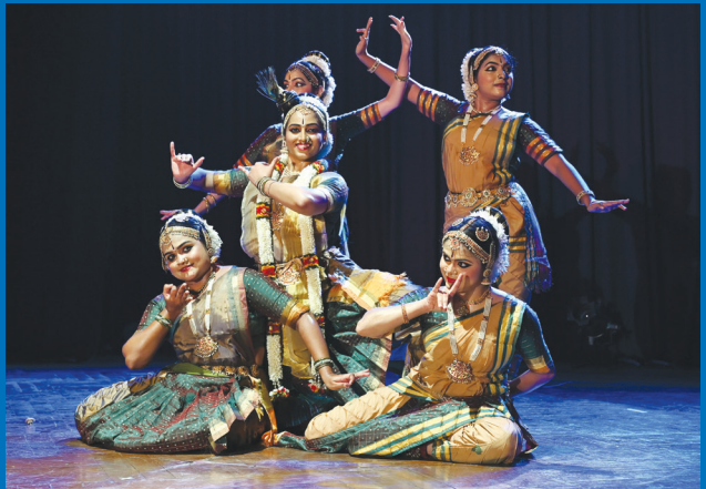
విశాఖమ్యూజిక్ అకాడమి, విశాఖ వారి వార్షికోత్సవాలలో Art India Foundation వారు అందించిన నృత్యకార్యక్రమంలో పాల్గొన్న నర్తకీమణుల బృందం