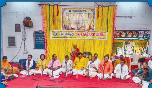
శ్రీరామగానసభ 54వ ఆ్కారాజ ఉత్సవాలలో పంచరత్న బృందగానదృశ్యం.