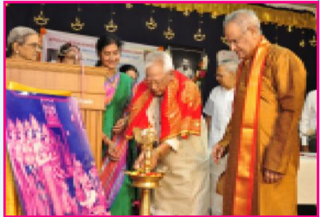
తణుకు శ్రీ త్యాగరాజ ఉత్సవాలను జ్యోతి ప్రజ్ఞలనతో ప్రారంభిస్తున్న పద్మశ్రీ, నాదసుధార్ణవ శ్రీ అన్నవరపు రామస్వామి