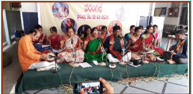
వరంగల్ జరిగిన త్యాగరాజ ఆరాధన